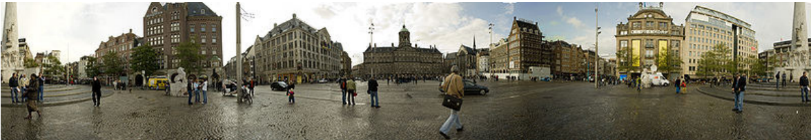
Panorama van de Dam in Amsterdam.

De stad Amsterdam toont haar oorsprong aan in haar naam; een dam in de rivier de Amstel. Deze dam is gelegd in het begin van de dertiende eeuw op de plaats waar nu het huidige Damplein is. Oorspronkelijk vormde De Dam een verbinding tussen twee nederzettingen op de plaats van de huidige Warmoesstraat en Nieuwendijk aan weerszijden van de rivier. Geleidelijk aan werd De Dam breder gemaakt, groot genoeg voor een plein hetwelk de kern van de stad werd en waaromheen de stad zich verder ontwikkelde.