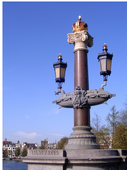
Lantaarns met Keizerskroon op de Blauwbrug