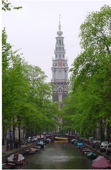
In de Zuiderkerk werden de eerste kolonisten gevoed

Levend Water een Zee van mensen te worden en zij een gebied zouden gaan bevolken welke Amerika zou gaan heten.