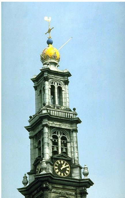
De Westertoren met de Keizerskroon

Opmerkelijk is het dat getrouwheid is betoont aan Dan. Dit is te zien aan de kroon van de Habsburger dynastie boven het schild die zij kreeg in 1489 van Maximiliaan I van Oostenrijk. Deze kroon prijkt ook op de toren van de protestantse Westerkerk en op de Blauwbrug 5 .