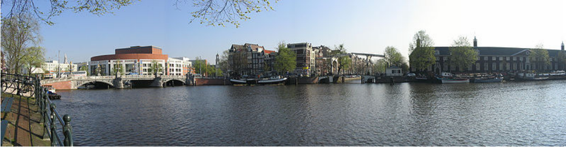
Panoramisch gezicht van de Amstel op de Blauwbrug en Amstelhof